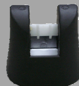
マグネット部一式